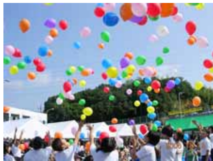
交通安全市民の集い