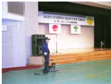
和泉市安全な町づくり推進協議会総会での 警察犬デモンストレーション