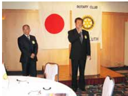
11月のお誕生日のお祝い