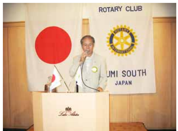
西家会員による胃カメラの話